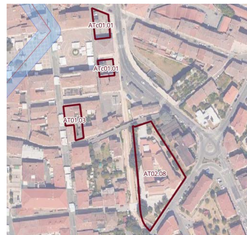
Figura 4 – Asta del reticolo idrografico regionale e vincolo dei 10 m dal ciglio di sponda (Art. 3 LR 41/2018)