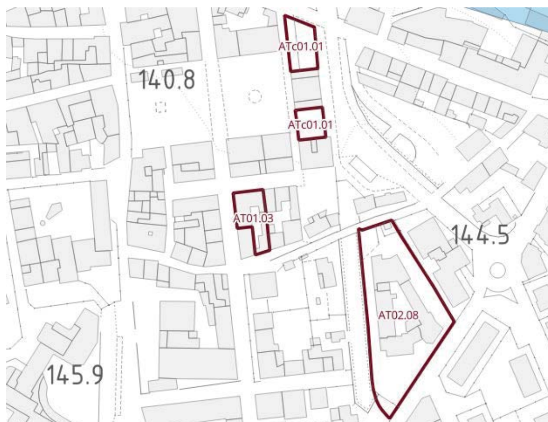
Figura 3 - estratto della carta di pericolosità per alluvioni